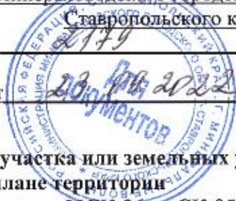
Схема расположения земельного участка или земельных участков на кадастровом плане территории

Система координат: МСК-26 от СК-95 зона 1